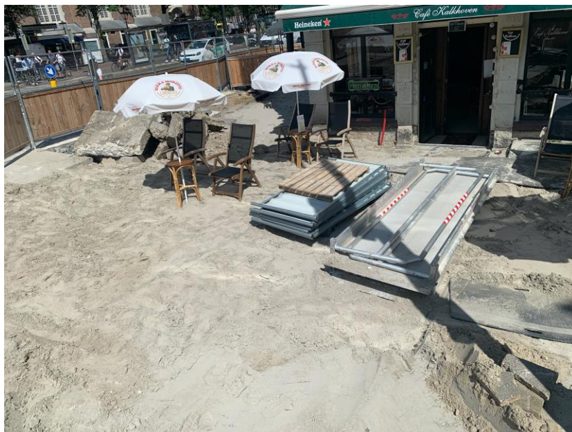
(bij café Kalkhoven)