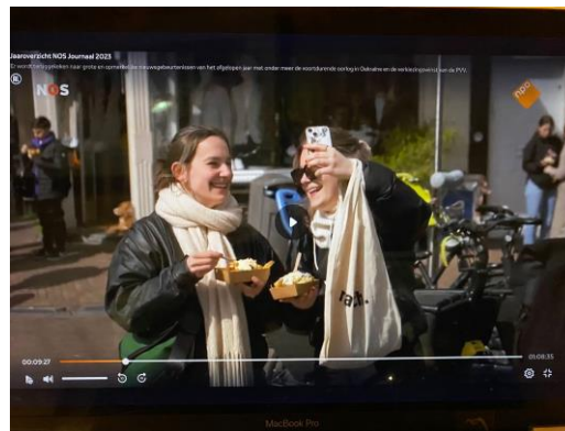
beelden uit NOS Jaaroverzicht dd 2023